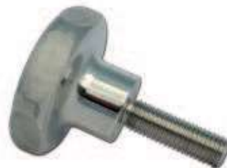
VOLANINI INOX A LOBI - FILETTO MASCHIO STAINLESS STEEL KNOBS - MALE