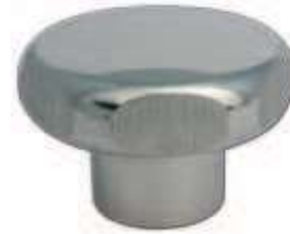
VOLANINI INOX A LOBI - FILETTO FEMMINA STAINLESS STEEL KNOBS - FEMALE